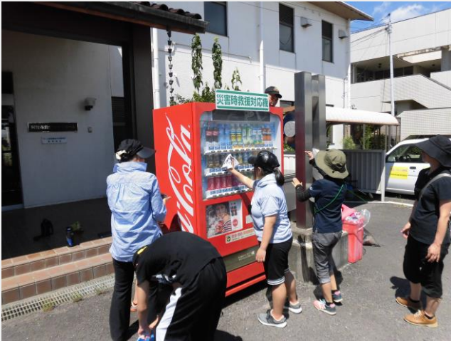
準備&バーベキュー